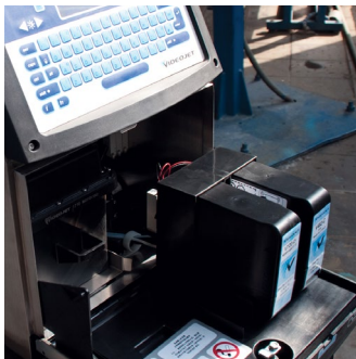
Sistema de dosificación de fluidos Smart Cartridge™ en el nuevo codificador Videojet 1710

“Cuando se combinan las altas velocidades de producción, las altas temperaturas y las condiciones ambientales de la fábrica, se necesitan tintas resistentes y una impresora que no se obstruya durante el funcionamiento —explica Ju ChaoRong—. “Hemos encontrado todo esto en Videojet. Podemos usar cualquier tinta que necesitemos en los codificadores 1710 sin ningún problema, incluso tinta pigmentada de alto contraste. Además, la tinta se seca extremadamente rápido con una excelente adhesión y soporta nuestra alta velocidad de producción”.